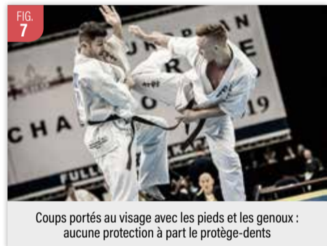
Coups portés au visage avec les pieds et les genoux : aucune protection à part le protège-dents