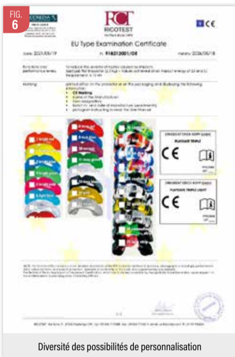
Diversité des possibilités de personnalisation

Sur les karatékas (majorité des athlètes traités), j'ai pu observer des altérations communes et récurrentes : les lésions traumatiques et leurs répercussions. De façon assez inattendue les accidents surviennent principalement lors des entraînements et rarement lors des compétitions.