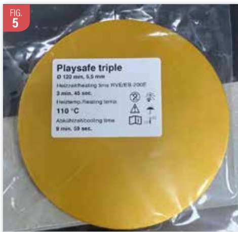
Plaque dorée de 5,5 mm destinée à la confection d'un protège-dents pour boxeur