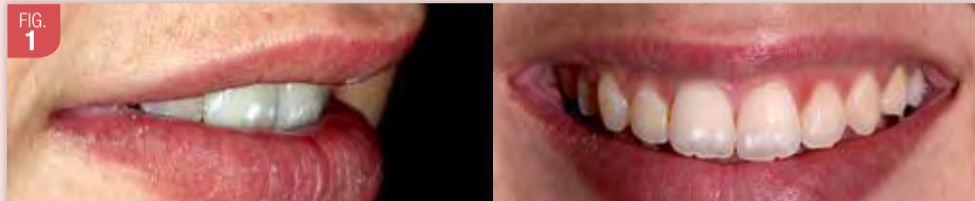
Jeune patiente présente des taches apparues selon elle après un traitement orthodontique

Les white spot, ou lésions précaries, sont les taches blanches les plus retrouvés chez nos patients. Il s'agit aussi des lésions les plus simples à traiter. Leurs étiologies permettent de comprendre la nature superficielle de la lésion et non recouverte par un émail sain (même si la surface est souvent reminéralisée secondairement à la déminéralisation). Cette illustration a pour objectif de guider un praticien réalisant ces premiers traitements d'érosion / infiltration. Commencer par ces taches permet de manière relativement simple d'obtenir de bons résultats.