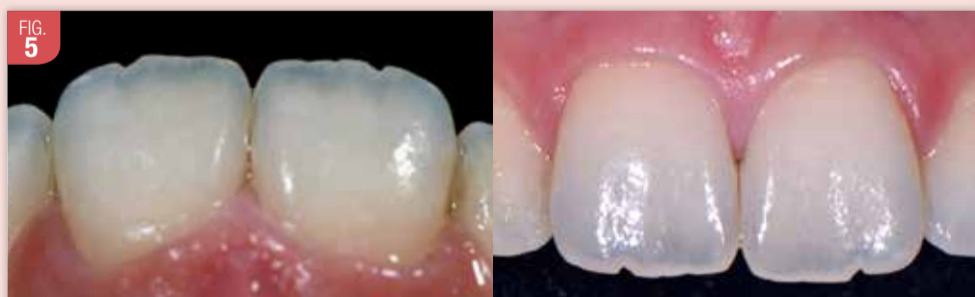
Même si une stratification de composite n'est pas nécessaire, il est essentiel de soigner le polissage de la dent traitée (limitant le risque de colorations secondaires).