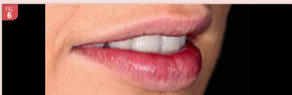
Résultat esthétique, plusieurs mois après le traitement, relativement simple à obtenir, même pour un praticien débutant dans ces traitements.