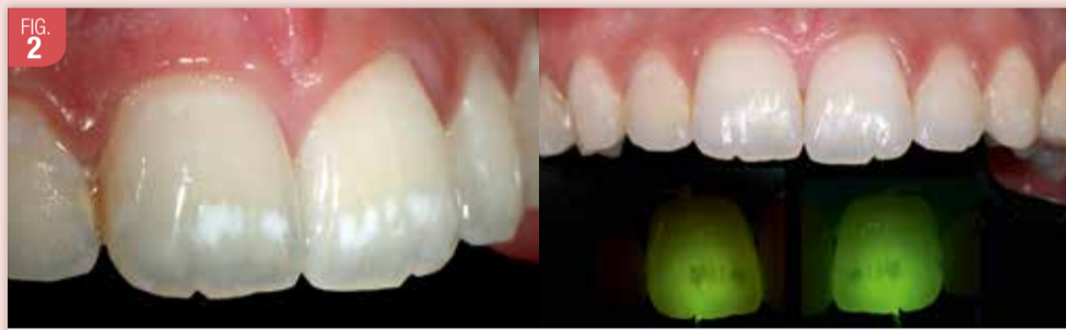
On peut facilement deviner la place des anciens brackets ODF, délimités par les lésions précaries. Une interrogation se pose sur les lésions proches du bord libre des incisives centrales, pouvant aussi correspondre à une fluorose.