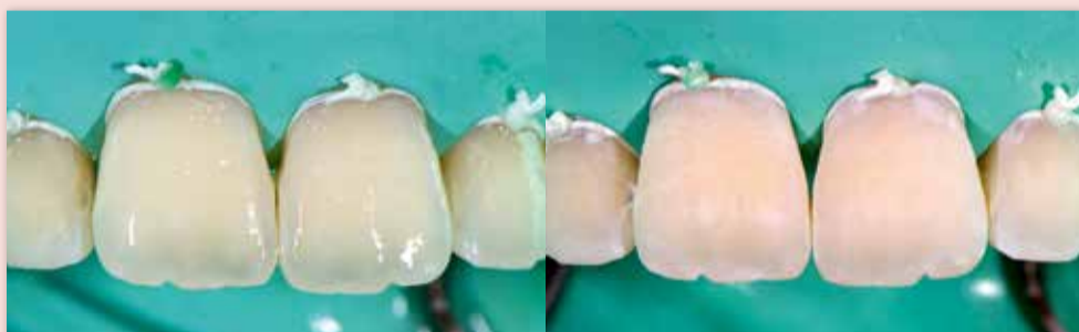
L'atténuation optique de la lésion pendant l'application de l'icône dry est un prérequis à l'infiltration. L'ethanol a pour objectif de sécher la lésion pour permettre une meilleure pénétration de l'icon infiltrant.