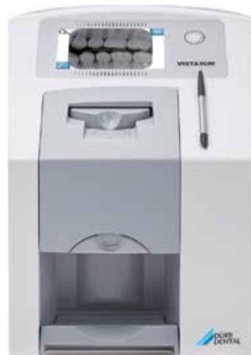
VistaScan Mini View