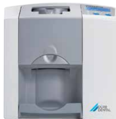
VistaScan Mini Plus