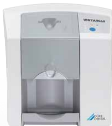
VistaScan Mini Easy